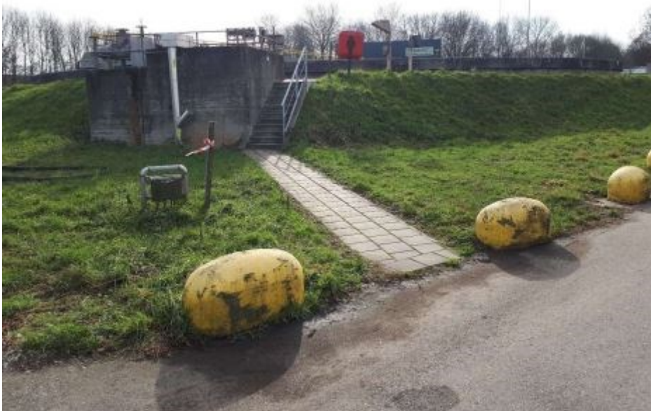
No 7: Kalkmelkaanmaakinstallatie