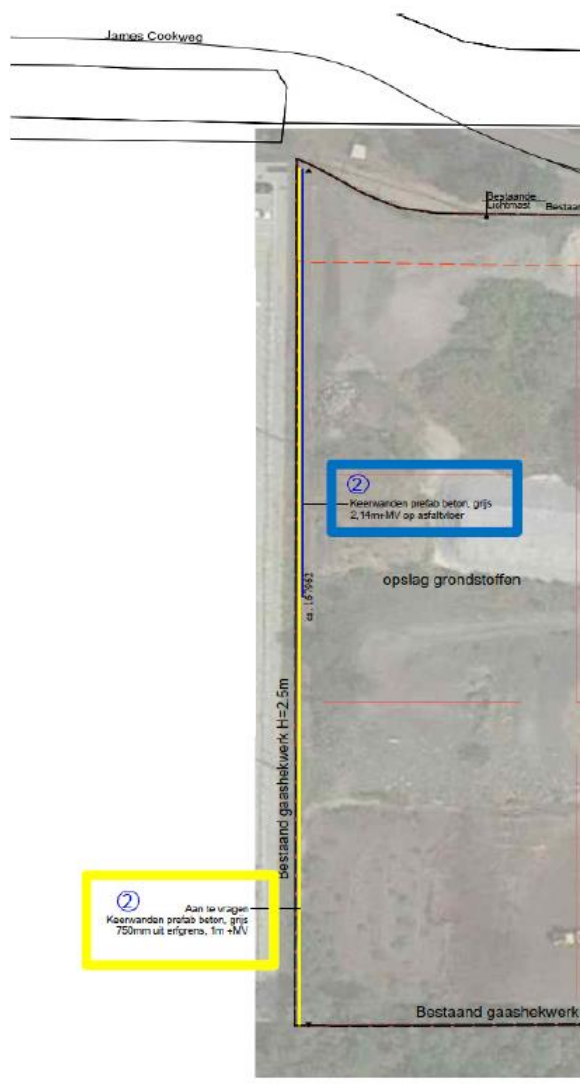
Figuur 1: uitsnede situatie keerwanden