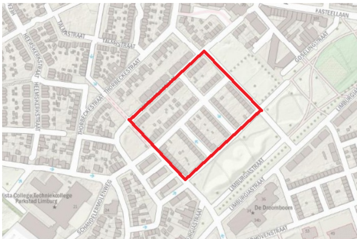
Figuur 1: Het plangebied