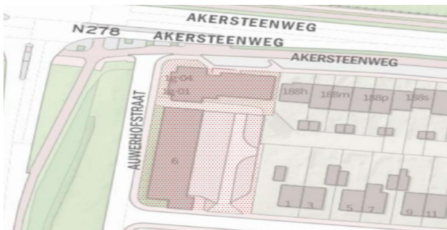
Figuur 2: Het plangebied Auwerhofstraat 1 t/m 20