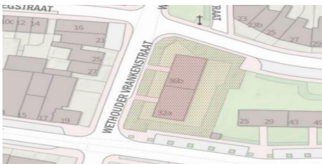
Figuur 3: Het plangebied Wethouder Vrankenstraat 30 t/m 36c