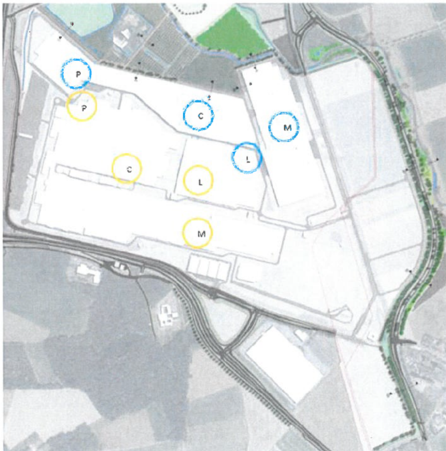
Figuur 1: Ligging plangebied, gele cirkel = bestaande bebouwing, blauwe cirkel = beoogde uitbreiding

Als voorbereiding op de werkzaamheden is wel al gestart met het realiseren van het compensatiegebied. Hierbij worden de landdelen ingericht volgens het 'Mitigatie- en compensatieplan, Uitbreiding VDL Nedcar te Born' van 30 oktober 2020 en worden voorzieningen zoals vleermuiskasten gerealiseerd. De planning van de werkzaamheden moet uiterlijk 6 weken voor start van de werkzaamheden aan de Provincie Limburg voorgelegd worden.