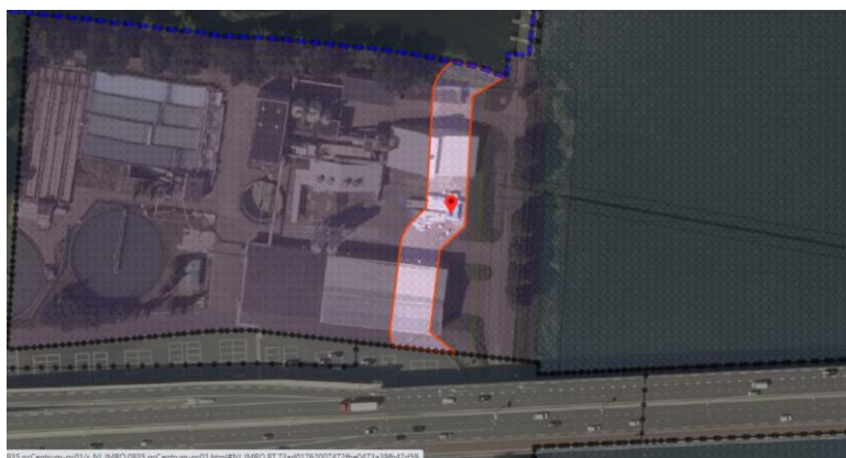
Afbeelding 1: Fragment ruimtelijke plannen: Dubbelbestemming ' Waterstaat – Beschermingszone waterkering '

Volgens artikel 22.1 van de planregels zijn de voor ' Waterstaat - Beschermingszone waterkering ' aangewezen gronden, behalve voor de andere daar voorkomende bestemming(en), mede bestemd voor de bescherming, het beheer en het onderhoud van de waterkering (zie afbeelding 1).