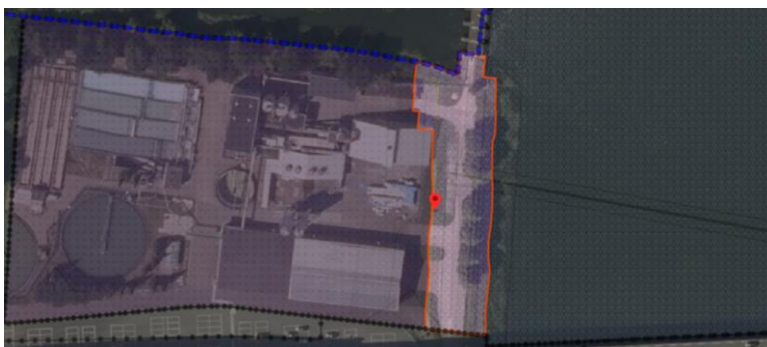
Afbeelding 4: Fragment ruimtelijke plannen: Gebiedsaanduiding 'Vrijwaringszone-vaarweg'

Volgens artikel 29.11.1 onder a van de planregels mogen op de gronden ter plaatse van de aanduiding 'vrijwaringszone – vaarweg', ongeacht het bepaalde in de afzonderlijke bestemmingen, geen gebouwen en bouwwerken, geen gebouw zijnde worden opgericht (zie afbeelding 4).