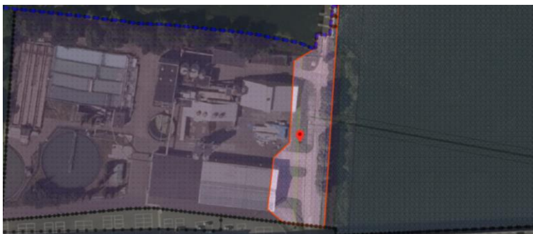
Afbeelding 2: Fragment ruimtelijke plannen: Dubbelbestemming ' Waterstaat – Waterkering '

Volgens artikel 24.1 van de planregels zijn de voor ' Waterstaat - Waterkering ' aangewezen gronden, behalve voor de andere daar voorkomende bestemming(en), mede bestemd voor dijken, kaden en andere voorzieningen ten behoeve van waterkering, en de daarbij behorende groenvoorzieningen, water en waterhuishoudkundige voorzieningen (zie afbeelding 2).