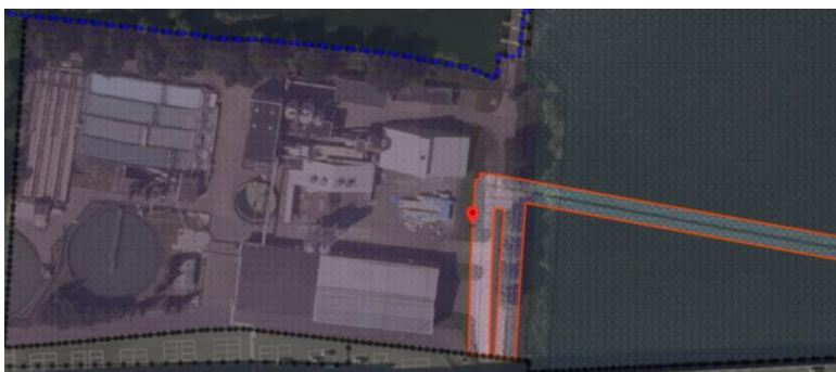
Afbeelding 3: Fragment ruimtelijke plannen: Dubbelbestemming ' Leiding – Gas '

Volgens artikel 18.1 van de planregels zijn de voor ' Leiding-Gas ' aangewezen gronden, behalve voor de andere daar voorkomende bestemming(en), primair bestemd voor de aanleg, instandhouding en/of bescherming van de aangeduide hogedruk gastransportleiding (zie afbeelding 3).