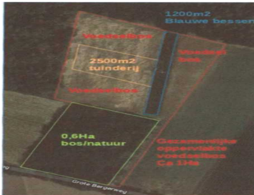
Figuur 2. locatie aan te leggen voedselbos perceel Sint Odiliënberg F 324