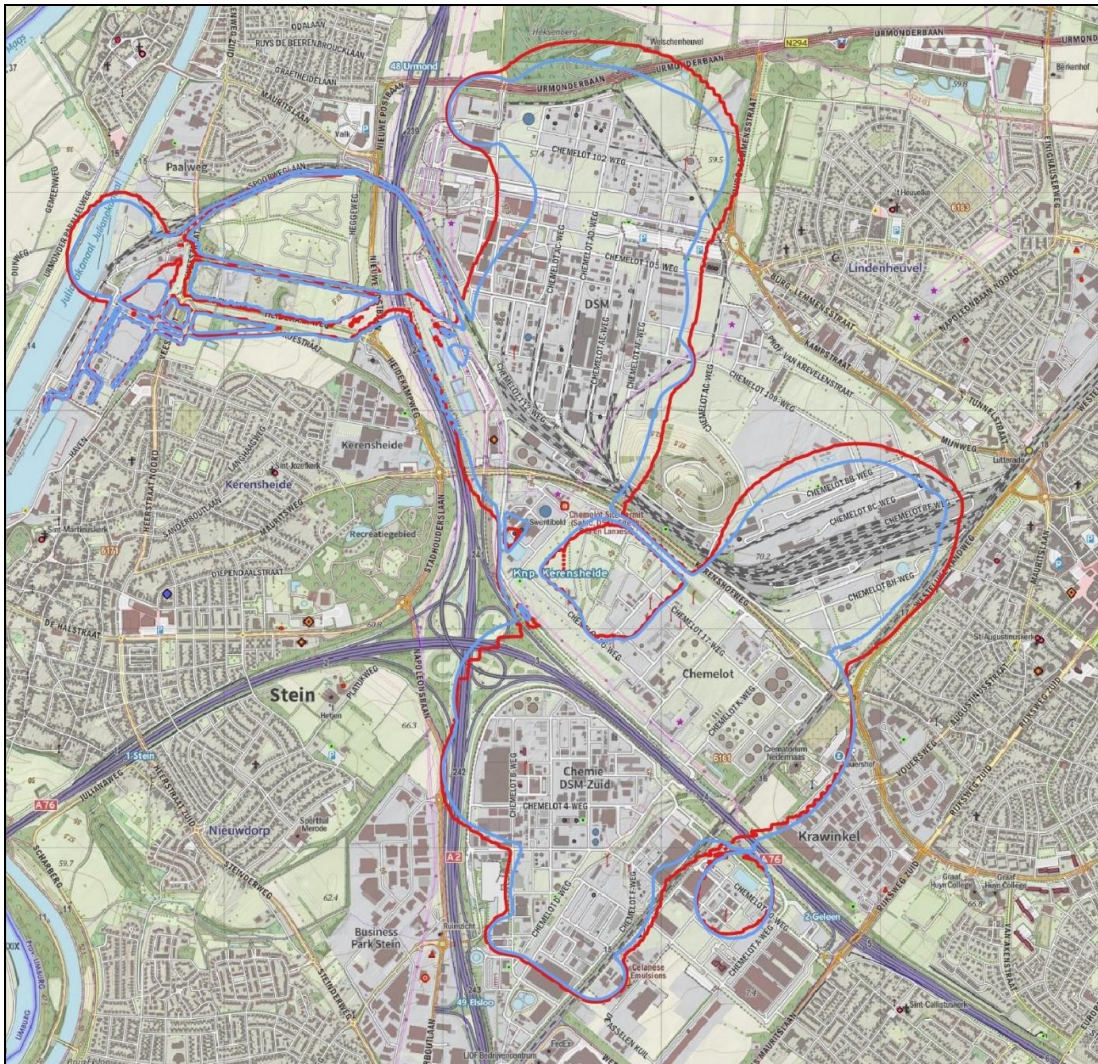
Figuur 1 PR 10^{-6} contour site Chemelot

Op een drietal locaties buiten de inrichting is sprake van een toename van de PR 10^{-6} contour: