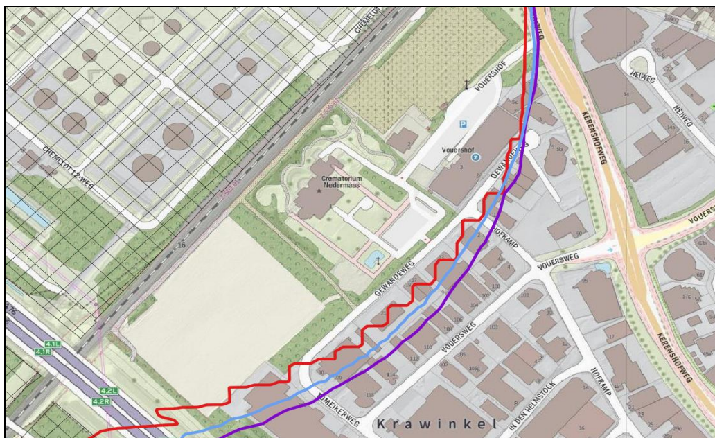
Figuur 2 PR contour ter hoogte van bedrijventerrein Krawinkel

Als gevolg van het gebruik van de nieuwe rekenmethodiek treedt er een verandering op in de omvang van de PR 10^{-6} contour ter hoogte van het bedrijventerrein Krawinkel. Voor een goede vergelijking is de thans beoordeelde contour (op basis van het besluit tot actualisatie van hoofdstuk 1) berekend met de nieuwe versie van Safeti-NL. In figuur 2 is duidelijk te zien dat de paarse contour verder over het bedrijventerrein komt te liggen dan de rode contour, ondanks dat hier dezelfde activiteiten ongewijzigd zijn opgenomen in het rekenprogramma. De wijzing in omvang van de PR 10^{-6} contour is toe te schrijven aan de rekenkundige toename in risico's van de opslag van tot vloeistof verdichte gassen.