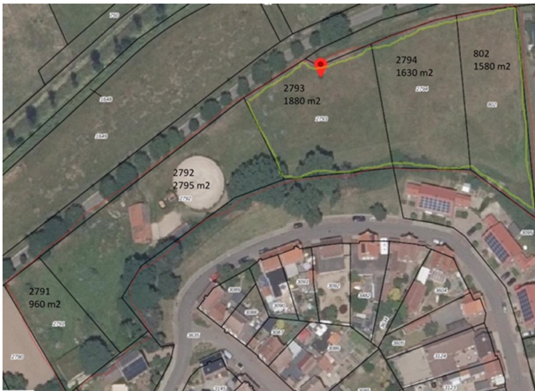
Figuur 2. Locaties aan te leggen voedselbos percelen Montfort C 2793, 2794 en E 802

Op de aangevraagde percelen aan de Broekweg, kadastraal bekend gemeente Montfort, sectie C, nummers 2793 en 2794 en sectie E, nummer 802 rust geen herplantverplichting vanuit de Wnb of andere wet- en regelgeving.