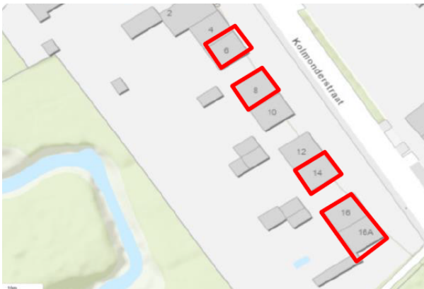
Figuur 1b: Het plangebied Kolmonderstraat, Nijswiller