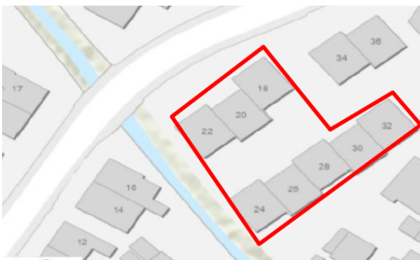
Figuur 1c: Het plangebied Ireneweg 18 t/m 32 (even), Nijswiller