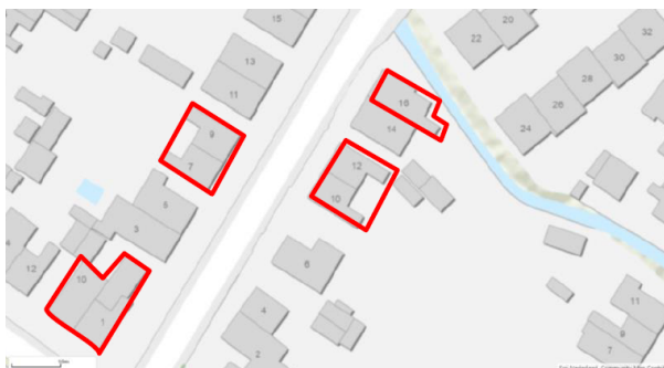
Figuur 1a: Het plangebied Irenweg 1, 7, 9, 10, 12, 16, Schulsbergweg 10, Nijswiller