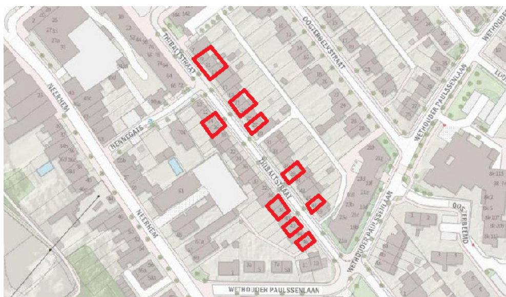
Figuur 1: Het plangebied