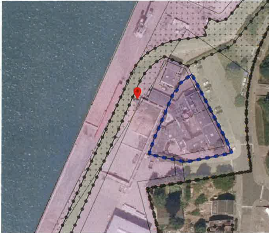
Locatie: stapelblokkenwanden (keerwanden), bulkopslag 2

de te beschermen waarden zoals bedoeld in het bestemmingsplan erfgoed Stein". Gelet op vorenstaande kan toepassing worden gegeven aan het bepaalde in artikel 5.2 van bestemmingsplan 2.