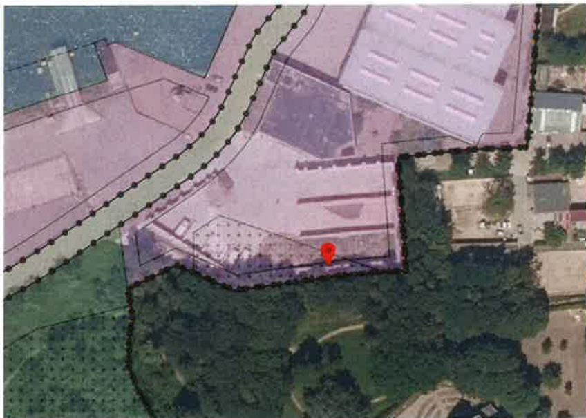
Locatie: stapelblokkenwanden (keerwanden), bulkopslag 1

Het geluidscherm hoeft niet te worden getoetst aan bestemmingsplan 2. De aanvraag is namelijk ingediend op 14 december 2018, ruim voordat het ontwerp van bestemmingsplan 2 ter inzage heeft gelegen. Nu dit bouwwerk niet in strijd is met het bestemmingsplan 1 dat ten tijde van indienen van de aanvraag vigeerde was er ten tijde van het indienen van de aanvraag voor dit bouwwerk een rechtstreekse aanspraak op een bouwvergunning. Gelet op de geldende jurisprudentie (ECLI:NL:RVS:2018:2010) geldt in die situatie dat alleen getoetst wordt aan het bestemmingsplan dat gold op het moment van indiening van de aanvraag. Voor de overige aangevraagde bouwwerken geldt dit niet. Deze zijn, zoals hieronder wordt beschreven, strijdig met bestemmingsplan 1 en dienen getoetst te worden aan de bestemmingsplan zoals deze gelden op het moment van het nemen van het besluit.