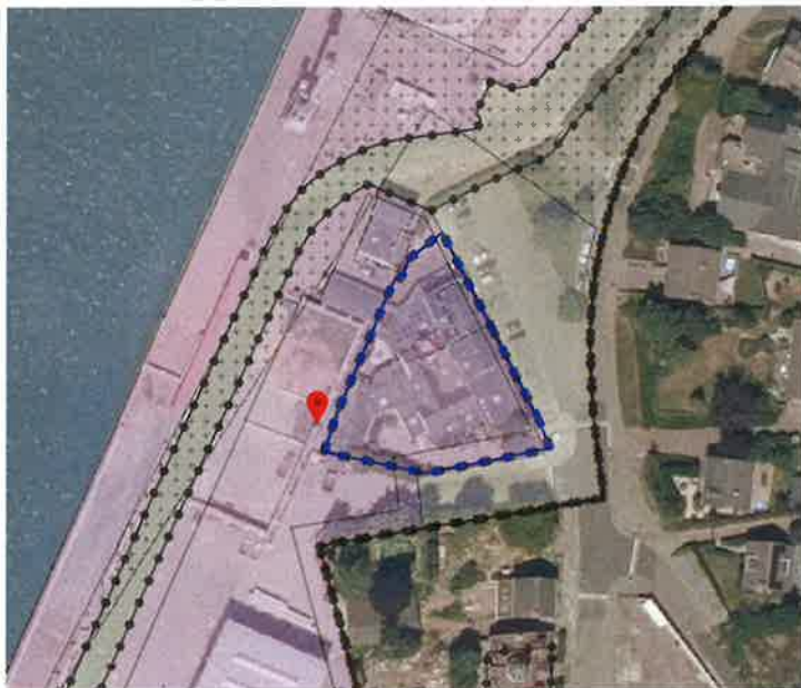
Locatie geluidscherm bovenop stapelblokkenwand

Ad. i. geluidscherm op/tegen een bestaande stapelblokkenwand op terreindeel 1