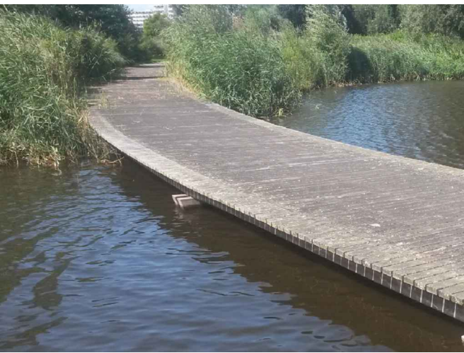
REFERENTIEBEEELD HOUTEN VLONDERBRUG NELSON MANDELAPARK