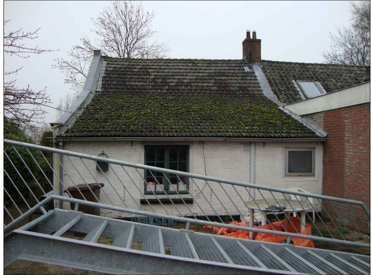
Foto's bestaande toestand