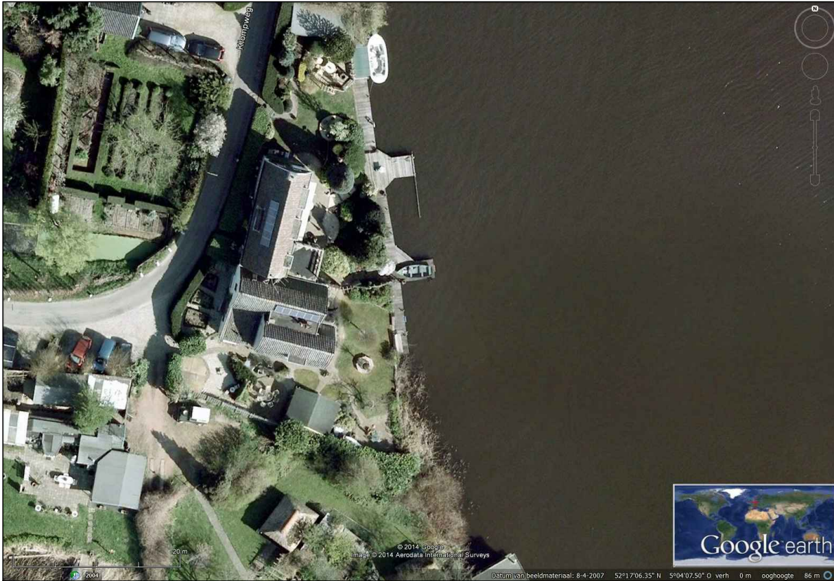
Luchtfoto bestaande toestand