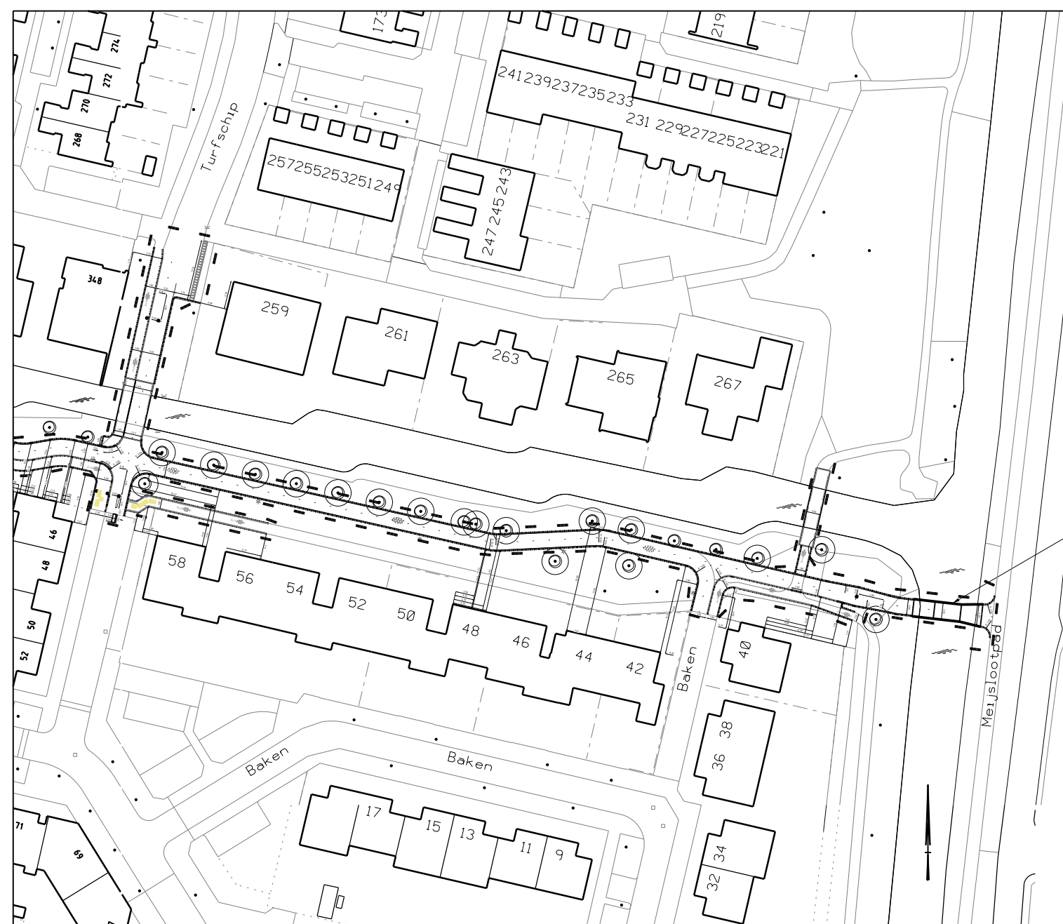
Locatie overzicht fietsbrug Meijslootpad Schaal 1:1000