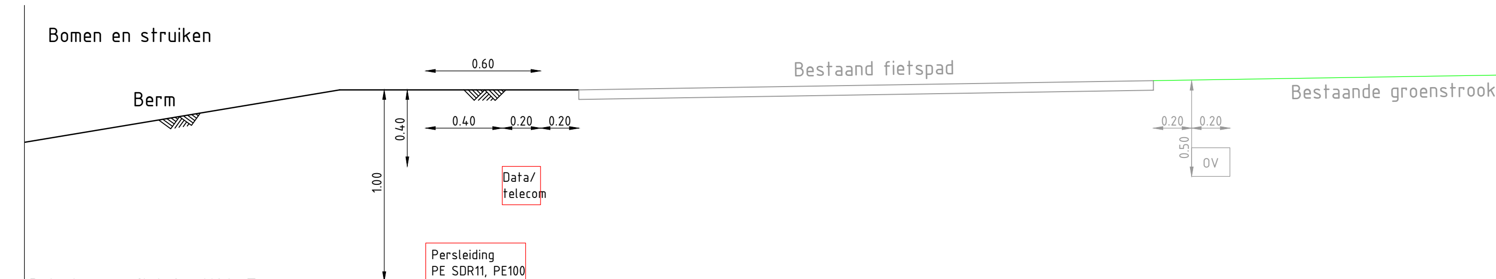
Principe profiel 2 : K&L Trace