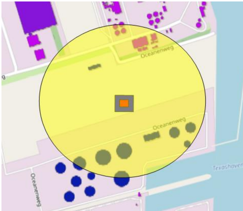
Figuur 1 - vooropnamen uitvoeren bij zes belendingen (geel= interieur+exterieur en groen= exterieur)

Om de huidige conditie van de belendende panden vast te leggen, moet vóór aanvang van de sloop en verdere werkzaamheden een bouwkundige opname worden uitgevoerd. Hierbij gaat het om een opname van het interieur en/of exterieur. Dit is afhankelijk van de locatie van de panden ten opzichte van de werkzaamheden.