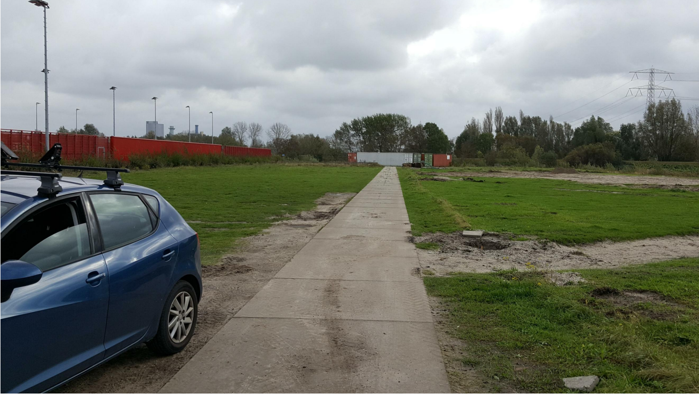
Fotos bestaande situatie