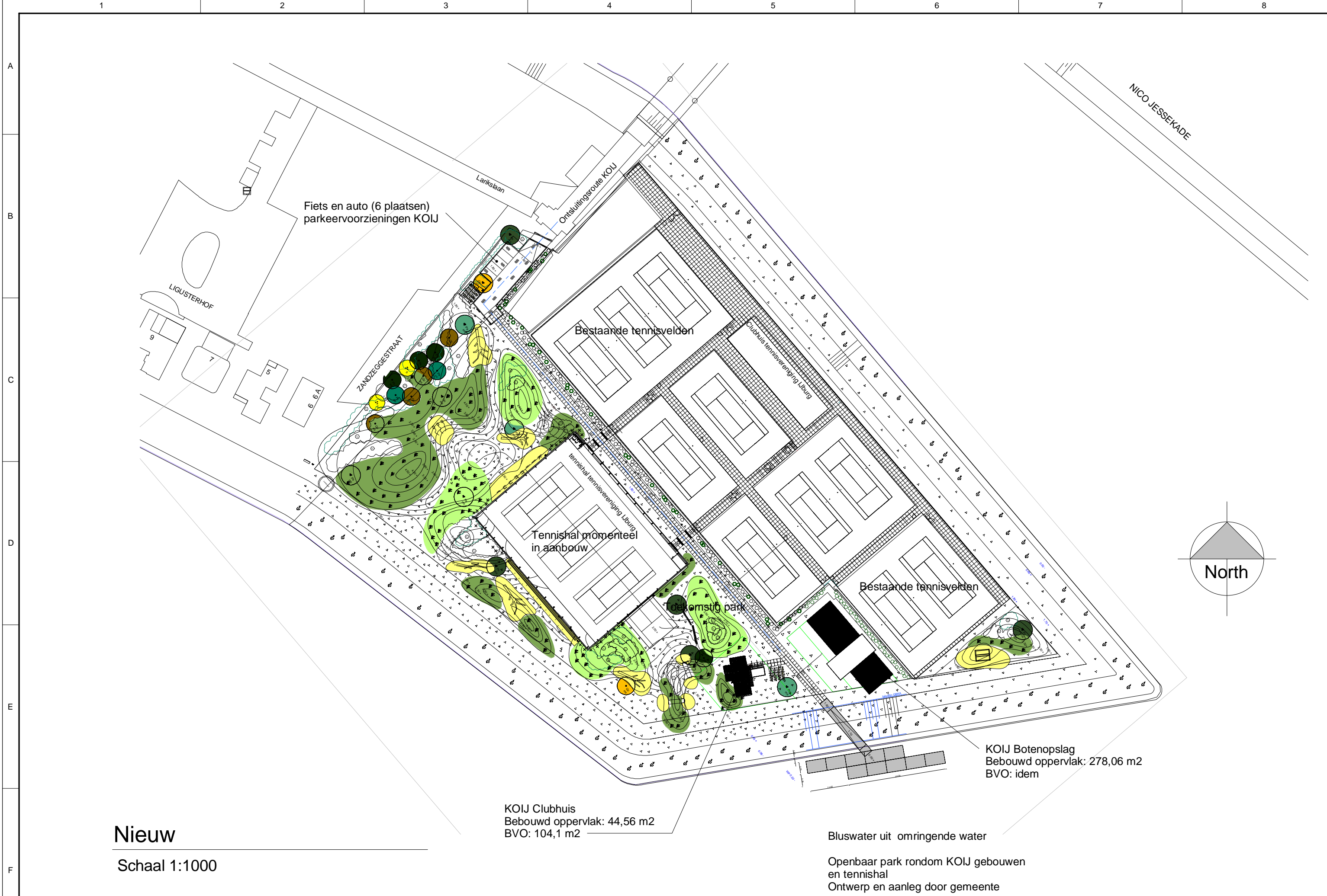
Nieuw Schaal 1:1000