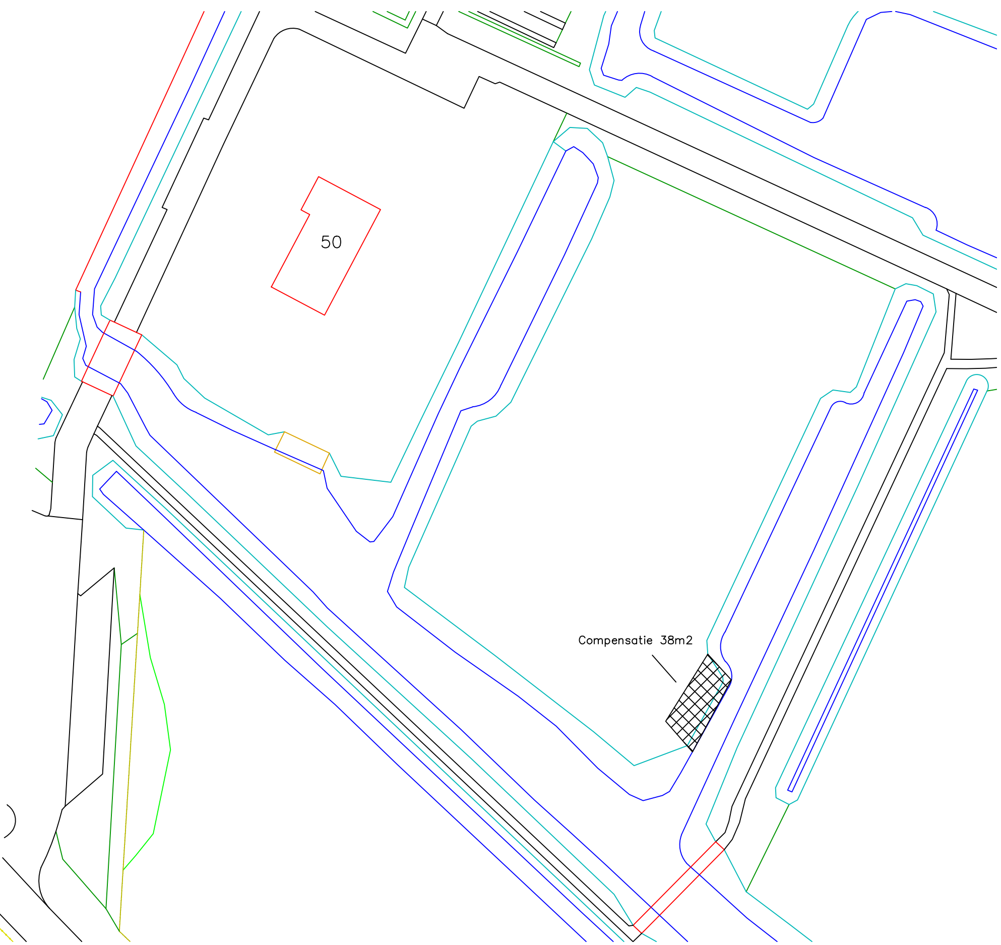
Voorstel compensatie kavel naast Vuurlijn 50 1:150