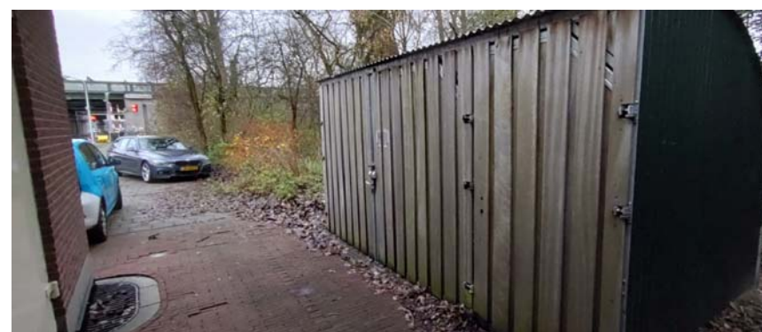
Foto's huidige situatie, omgeving