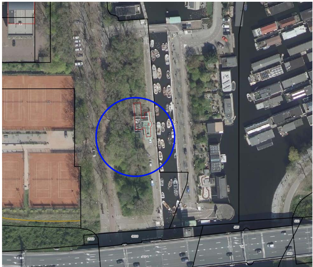
SITUATIE Gemeente Amsterdam Schaal: 1:2000 Sectie: F Nummer: 3247