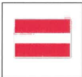
In-, uit- of doorvaart verboden (BPR, bijlage 7, A.1)