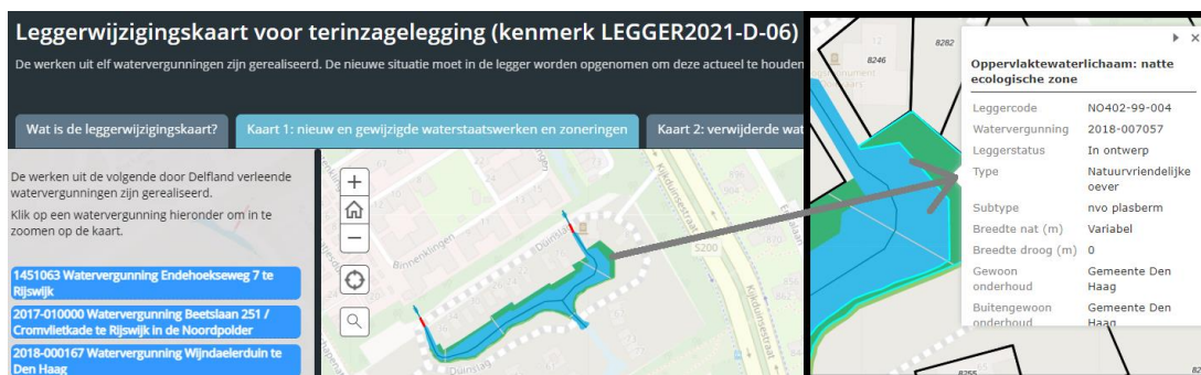
Figuur 1: Voorbeeld weergave van de interactieve leggerwijzigingskaart

Door op een waterstaatswerk op de kaart te klikken, opent er een pop-up scherm. Hierin staan de specifieke gegevens van dat waterstaatswerk, zoals de afmetingen of op wie de onderhoudsplicht rust. Ook kan, indien van toepassing, de bijlage met het leggerprofiel worden geopend. Een voorbeeld van de werking van de leggerwijzigingskaart is weergegeven in Figuur 1.