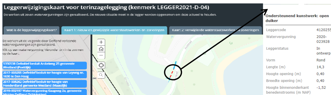
Figuur 1: Voorbeeld weergave interactieve leggerwijzigingskaart LEGGER2021-D-04

Door op een waterstaatswerk op de kaart te klikken, opent er een pop-up scherm. Hierin staan de specifieke gegevens van dat waterstaatswerk, zoals de afmetingen of op wie de onderhoudsplicht rust. Ook kan, indien van toepassing, de bijlage met het leggerprofiel worden geopend. Een voorbeeld van de werking van de leggerwijzigingskaart is weergegeven in Figuur 1.