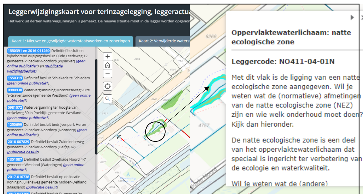
Figuur 1: Voorbeeld weergave van de interactieve leggerwijzigingskaart

Een voorbeeld van de werking van de leggerwijzigingskaart is weergegeven in Figuur 1.