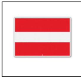
In-, uit- of doorvaart verboden (BPR, bijlage 7, A.1)