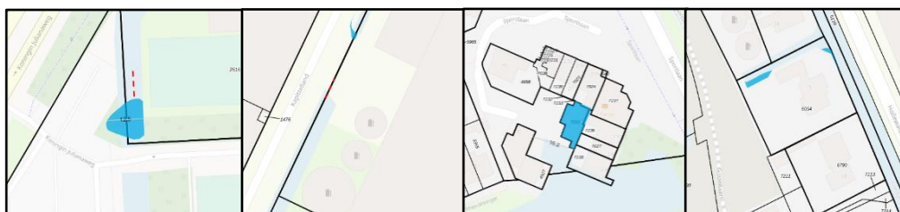
Julianaweg 150 's-Gravenzande Kapittelland 17 Hoek van Holland Sportlaan 27 De Lier Hollewatering 5 Poeldijk

Leggerwijziging volgt na uitvoering van de maatregelen uit de verleende watervergunningen met nummers 2017-001754 (Koningin Julianaweg 150 gemeente Westland ('s-Gravenzande)), 2017-004864 (Kapittelland 17, gemeente Rotterdam (Hoek van Holland)), 2018-003591 (Sportlaan 27, gemeente Westland (De Lier)), 2018-006723 (Hollewatering 5, gemeente Westland (Poeldijk)), 2018-009412 (Annie M.G. Schmidtdaan 22, gemeente Lansingerland (Berkel en Rodenrijs)), 2018-018395 (Polderweg 58 te Schiedam), 2018-020256 (Monstersepapad, gemeente Westland (Naaldwijk)), 2019-000408 (Rijksstraatweg 16 gemeente Midden-Delfland (Schipluiden)), 2019-002298 (Vlaminglaan/Middenweg 24 gemeente Westland (Poeldijk)) en 2019-015516 (Haakweg 25 gemeente Rotterdam (Hoek van Holland))