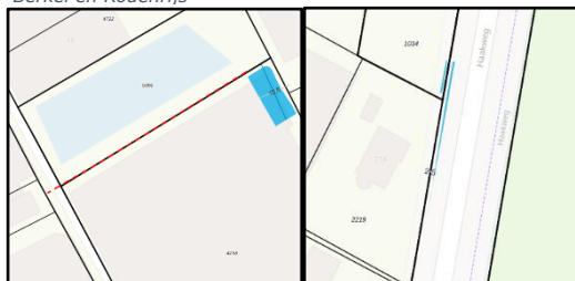
Vlaminglaan/Middenweg 24 Poeldijk Haakweg 25 Hoek van Holland