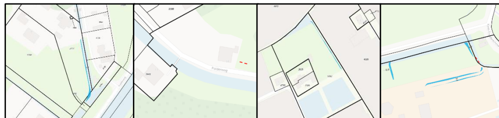
Annie M.G. Schmidtdaan 22 Berkel en Rodenrijs Polderweg 58 Schiedam Monstersepapad Naaldwijk Rijksstraatweg 16 Schipluiden