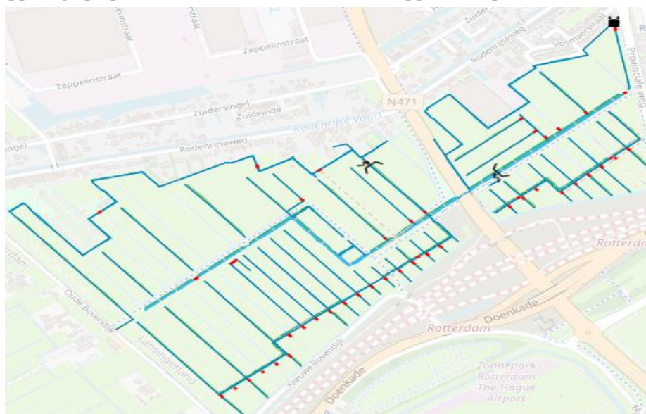
Figuur 1: 2016-010115, 2017-012291, 2016-015493 en 701979

Hieronder staan geografische, uitgezoomde, weergaven van de, met deze leggerwijziging, gewijzigde (onderdelen van) waterstaatswerken en zoneringen op de leggerkaart. Voor de precieze wijzigingen van waterstaatswerken en zoneringen (incl. de bijbehorende informatieschermen en evt. bijlagen met specifieke gegevens van de waterstaatswerken en zoneringen) moet de leggerwijzigingskaart worden bekeken. De leggerwijzigingskaart moet wél samen met de leggertekst gelezen worden.