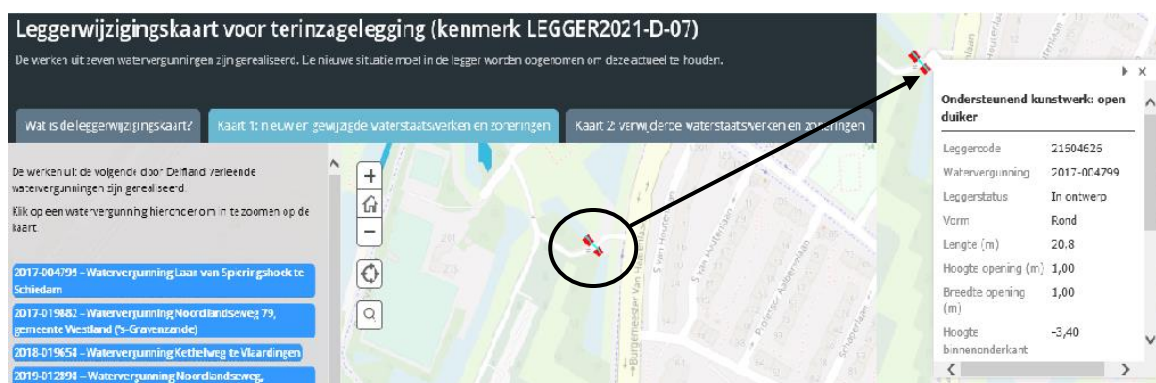
Figuur 1: Voorbeeld weergave interactieve leggerwijzigingskaart LEGGER2021-D-04

Door op een waterstaatswerk op de kaart te klikken, opent er een pop-up scherm. Hierin staan de specifieke gegevens van dat waterstaatswerk, zoals de afmetingen of op wie de onderhoudsplicht rust. Ook kan, indien van toepassing, de bijlage met het leggerprofiel worden geopend. Een voorbeeld van de werking van de leggerwijzigingskaart is weergegeven in Figuur 1.