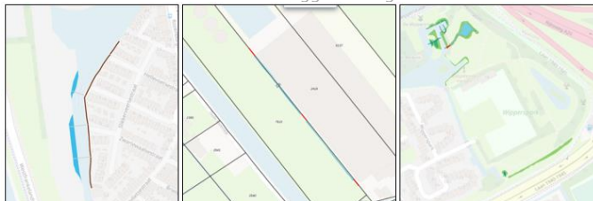
Watervergunningen van links naar rechts: 1351282, 2017-006538/2018-014385, 2018-005061 en 2018-007713

Hieronder staan geografische, uitgezoomde, weergaven van de, met deze leggerwijziging, gewijzigde (onderdelen van) waterstaatswerken en zoneringen op de leggerkaart. Voor de precieze wijzigingen van waterstaatswerken en zoneringen (incl. de bijbehorende informatieschermen en evt. bijlagen met specifieke gegevens van de waterstaatswerken en zoneringen) moet de leggerwijzigingskaart worden bekeken. De leggerwijzigingskaart moet wél samen met de leggetekst gelezen worden.