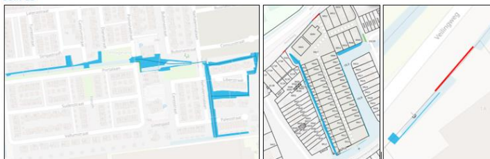
Watervergunningen van links naar rechts: 2017-016713/ 2019-005546, 2017-019361, 2019-002238, 2019-021703, 2020-027054 en 2021-007231.