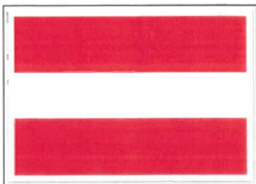
In-, uit- of doorvaart verboden (BPR, bijlage 7, A.I)