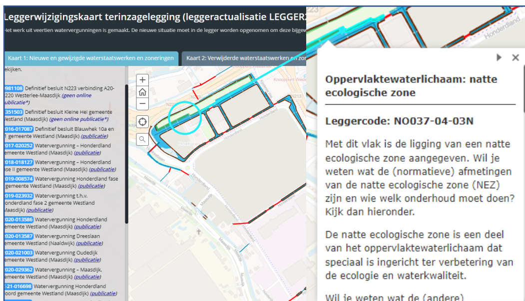
Figuur 1: Voorbeeldweergave van de interactieve leggerwijzigingskaart

Een voorbeeld van de werking van de leggerwijzigingskaart is weergegeven in Figuur 1.