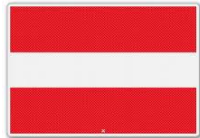
In-, uit- of doorvaart verboden (BPR, bijlage 7, A.1)