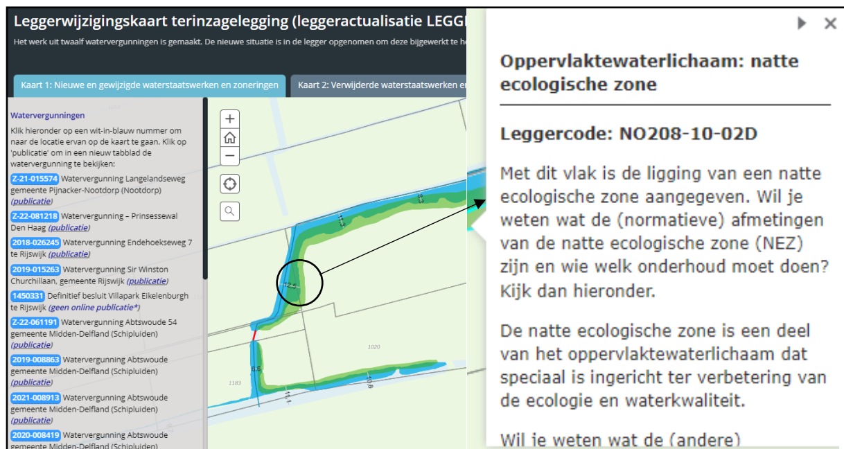
Figuur 1: Voorbeeld weergave van de interactieve leggerwijzigingskaart