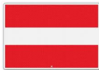
In-, uit- of doorvaart verboden (BPR, bijlage 7, A.1 )