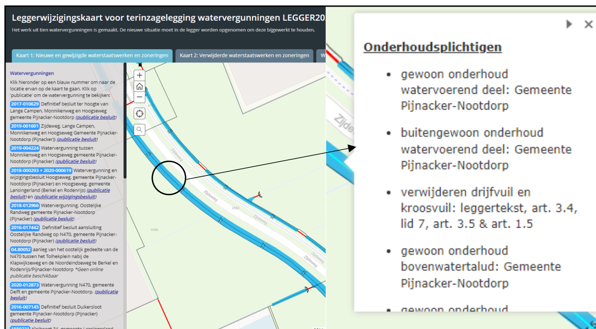
Figuur 1: Voorbeeld weergave van de interactieve leggerwijzigingskaart