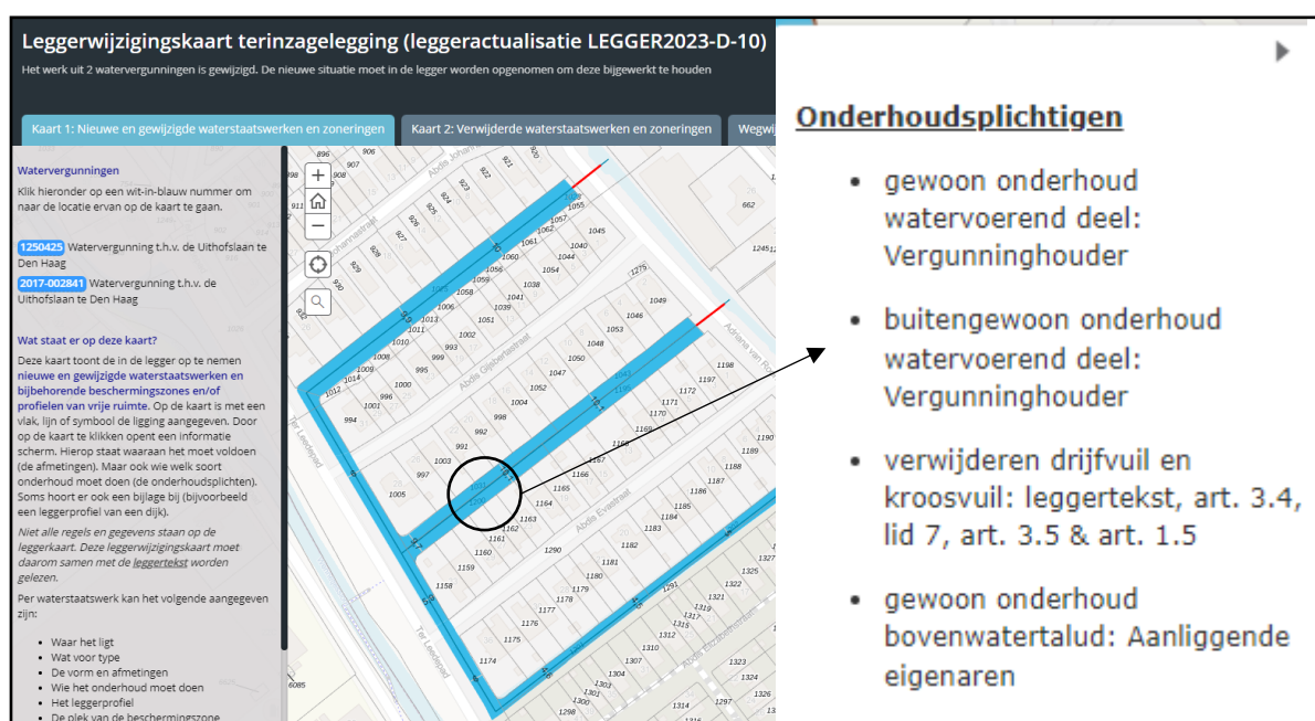
Figuur 1: Voorbeeld weergave van de interactieve leggerwijzigingskaart

Een voorbeeld van de werking van de leggerwijzigingskaart is weergegeven in Figuur 1 (volgende bladzijde).