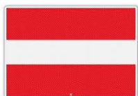
In-, uit- of doorvaart verboden (BPR, bijlage 7, A.1)