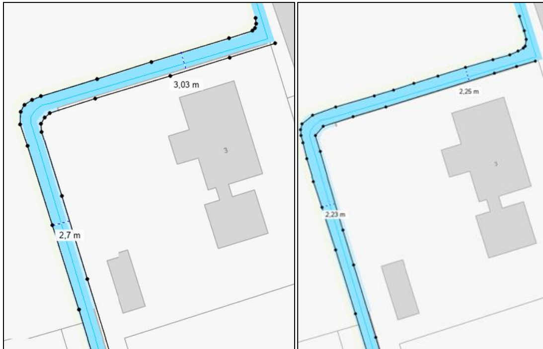
Figuur 3: Oplevering 2019

Bij het verwerken van de gegevens conform de vergunning en de oplevering (figuur 3) bleek de meting uit het veld ruimer dan afmeting uit de vergunning. De werkelijkheid (luchtfoto) bleek smaller dan de afmeting uit de vergunning en de meting uit het veld. Hierna zijn opnieuw metingen uitgevoerd (figuur 4) en deze afmetingen zijn op de kaart behorende bij het ontwerpbesluit opgenomen.