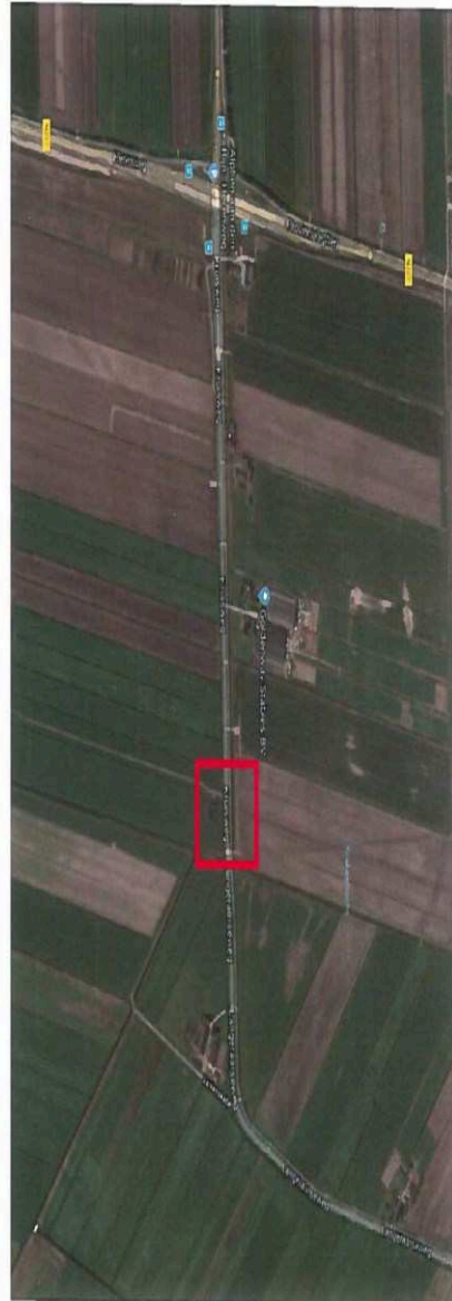
Overzicht locatie in- en uitrit werkverkeer: Kruisweg t.h.v. mestbassin / kruisweg 20 Woubrugge