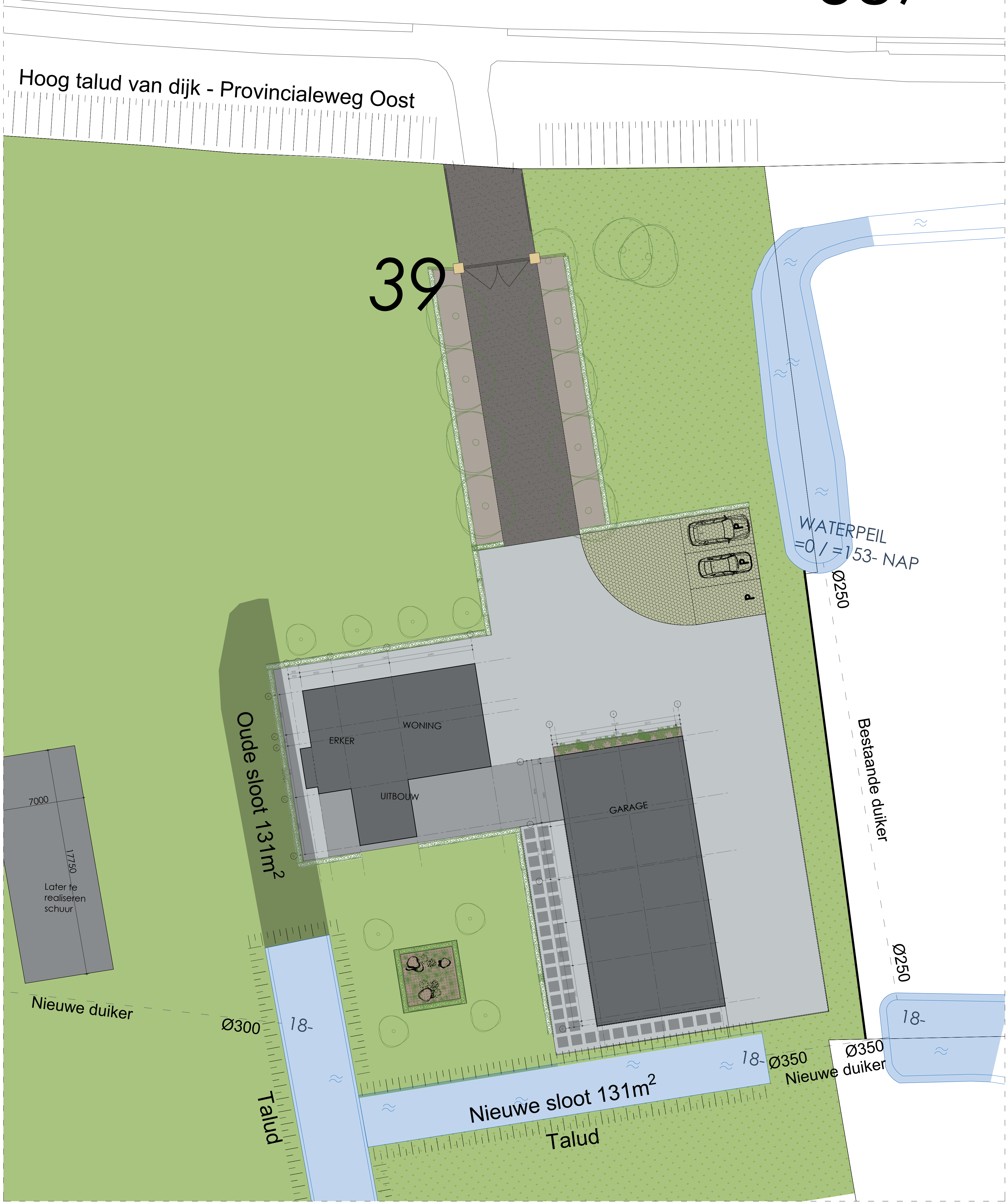
Nieuwe situatie Terreinplan 1:150