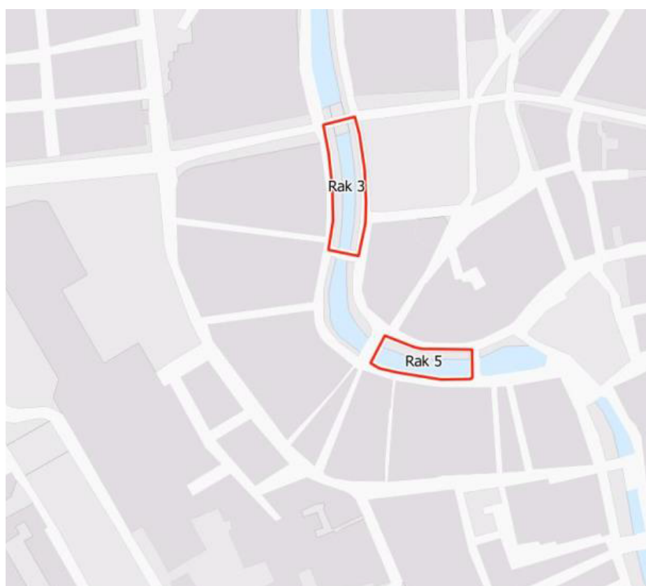
Figuur 1: Ligging van de te reconstrueren walmuren (rak 3 Oost en 5 Oost)

Deze vergunning heeft betrekking op de bemalingen in rak 3 (oostzijde) en rak 5 (oostzijde) langs de Oudegracht, voor de delen van de te reconstrueren walmuren zoals vermeld in tabel 1. De te reconstrueren muur heeft een lengte van in totaal 173 m. De locatie van de rakken zijn aangegeven in figuur 1