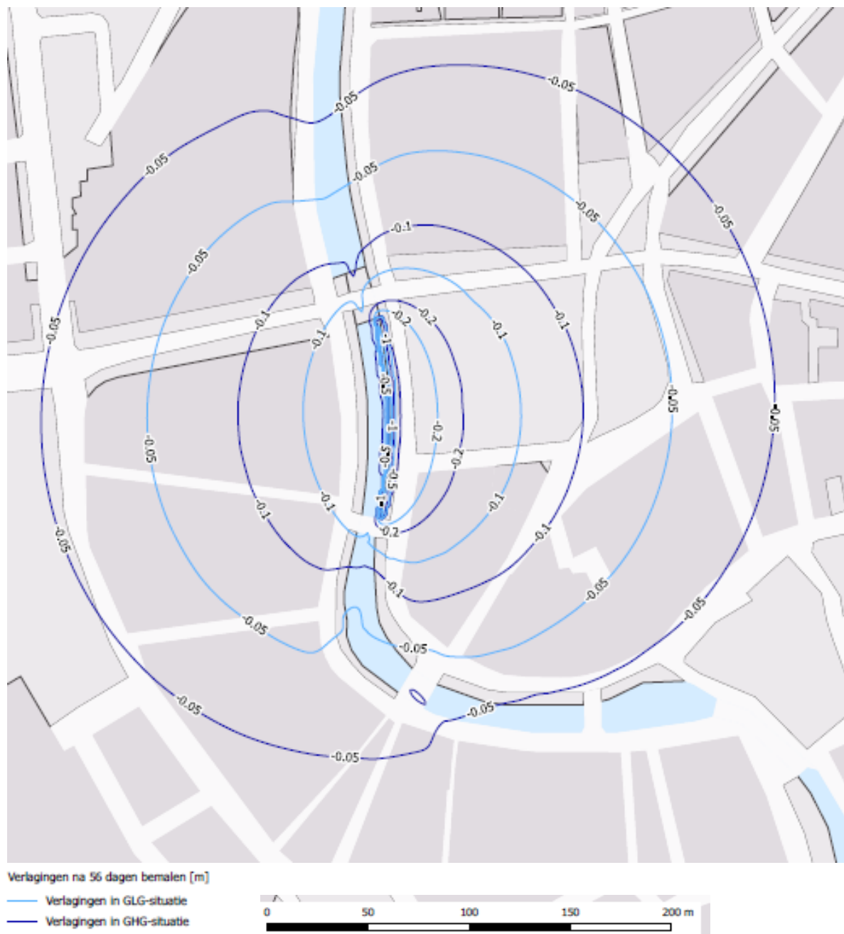
Figuur 2: Invloedsgebied van de bemaling tijdens GHS en GLS voor de fase met de grootste verlaging in rak 3