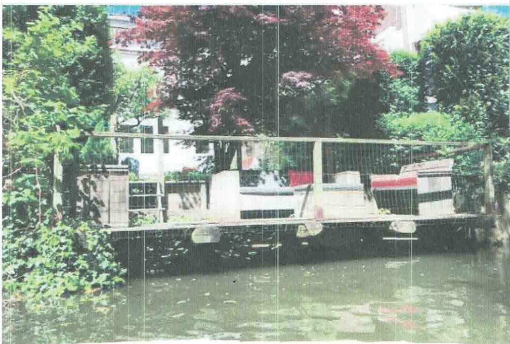
Vooraanzicht huidige situatie

Daarom deze foto van het vooraanzicht van de huidige vlonder (maart 2019) op Frederik Hendrikstraat 130.