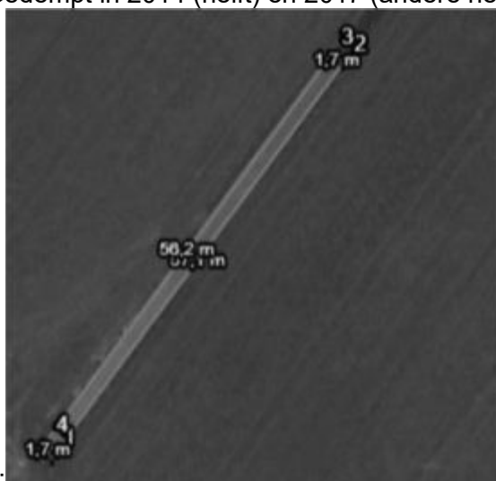
3: Gedempt in 2014 (helft) en 2017 (andere helft)