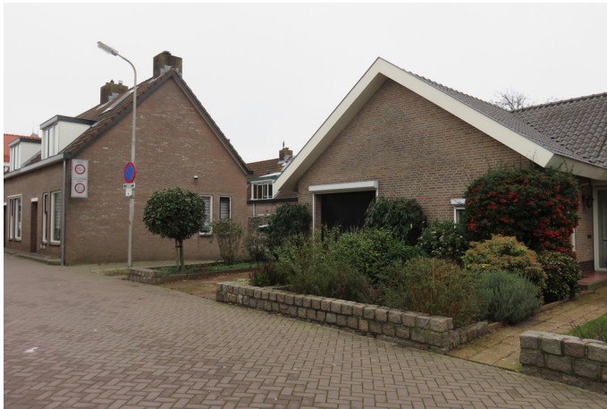
VOORGEVEL AAN DE MOLENWAL