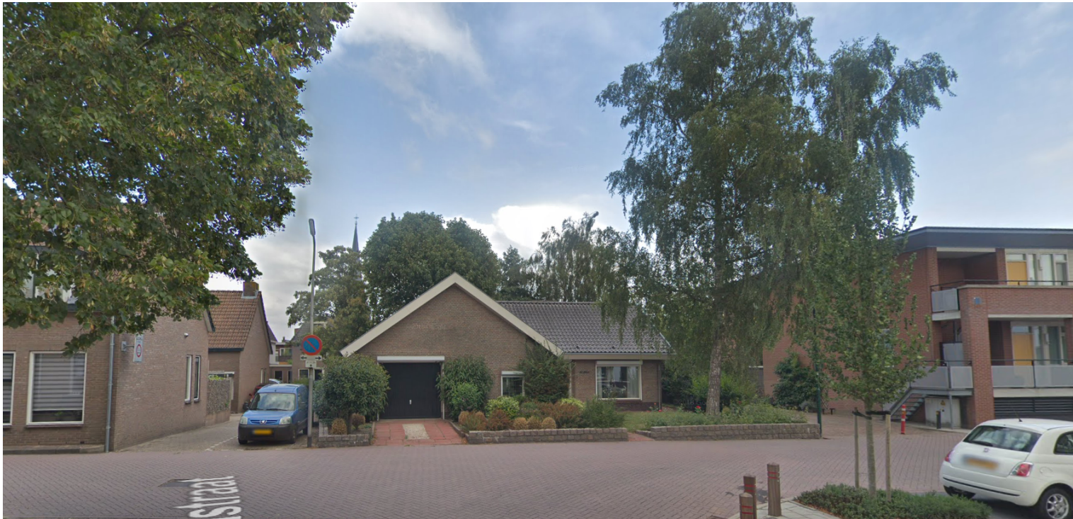
VOORGEVEL AAN DE MOLENWAL