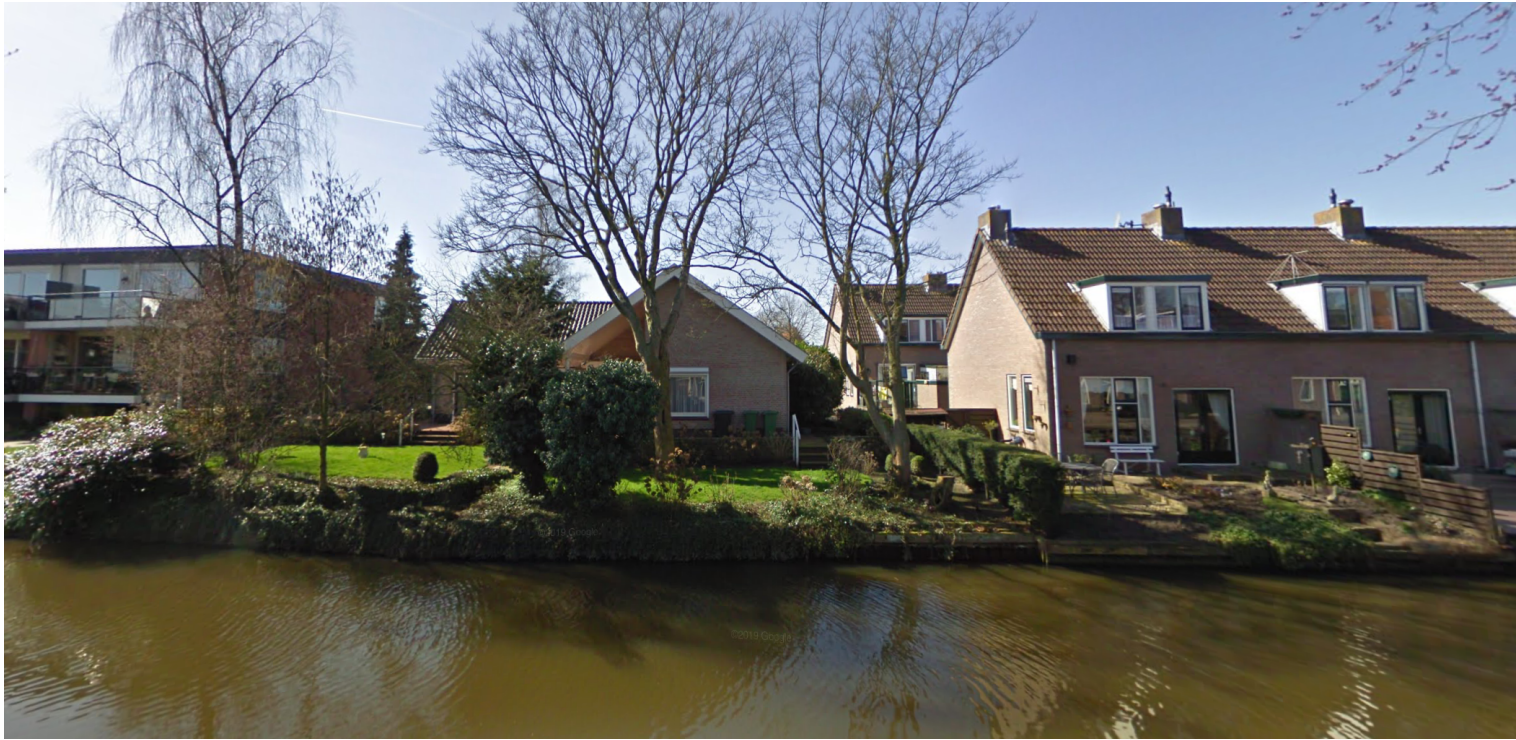
ACHTERGEVEL AAN DE HOLLANDSCHE IJSSEL