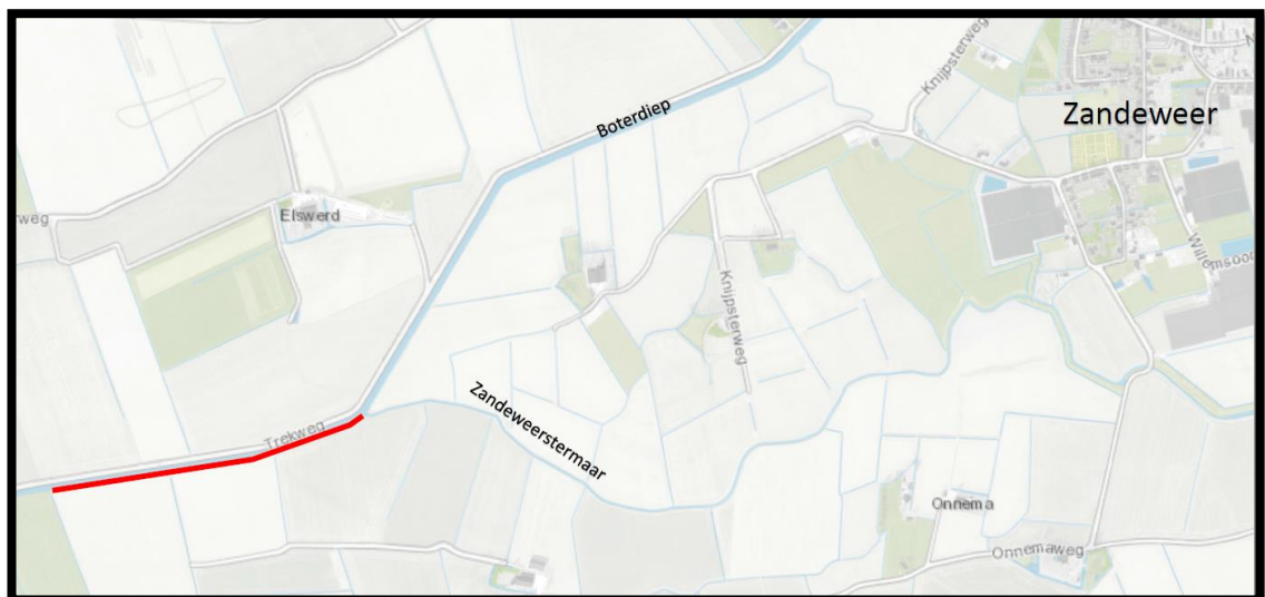
Figuur 1: Locatie

De oever die natuurvriendelijk wordt ingericht met een lengte van ongeveer 720 m 1 bevindt zich aan de zuidzijde van het Boterdiep. De locatie is in onderstaand figuur met een rode lijn weergegeven.