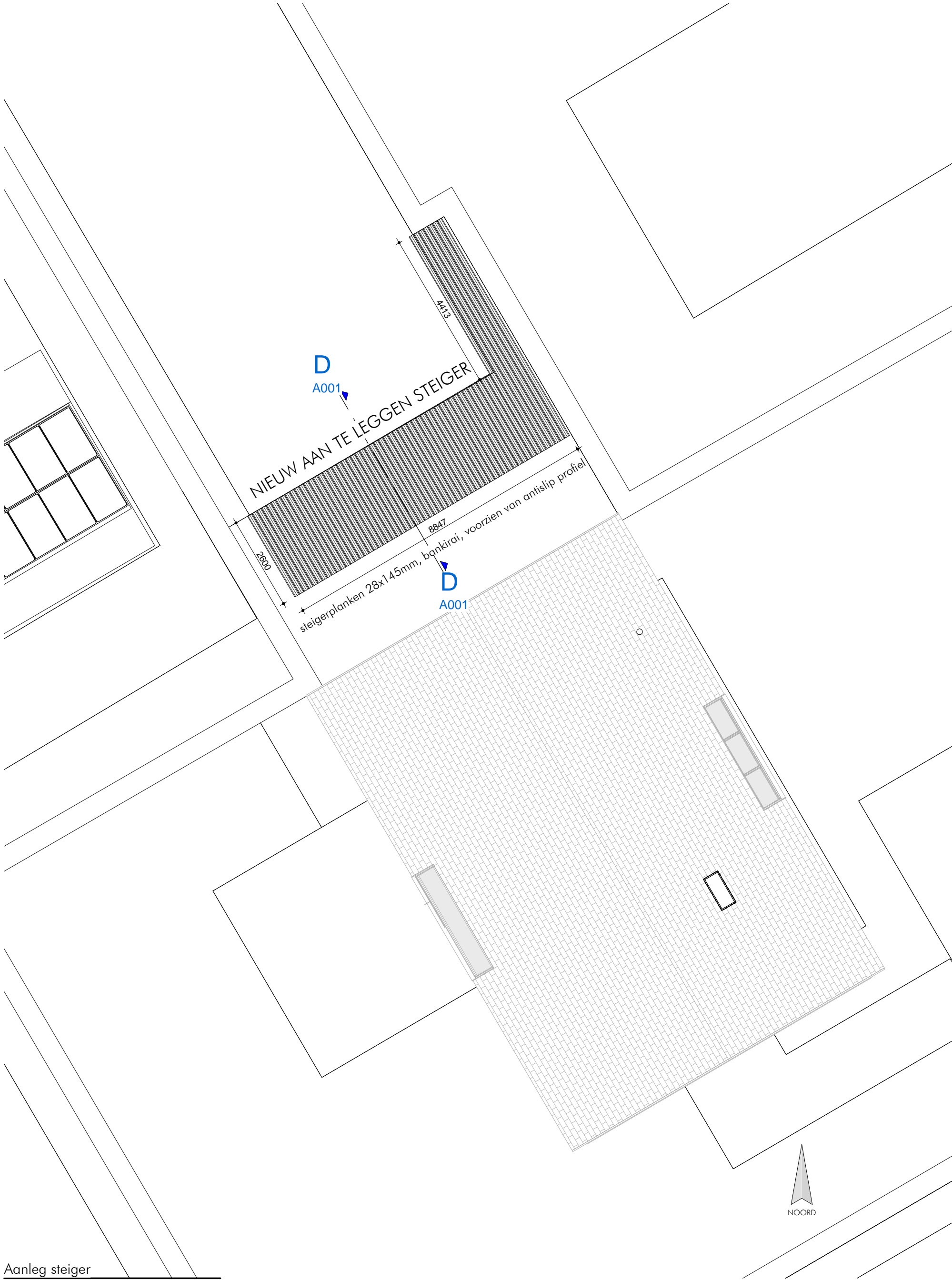
Aanleg steiger schaal 1 : 100