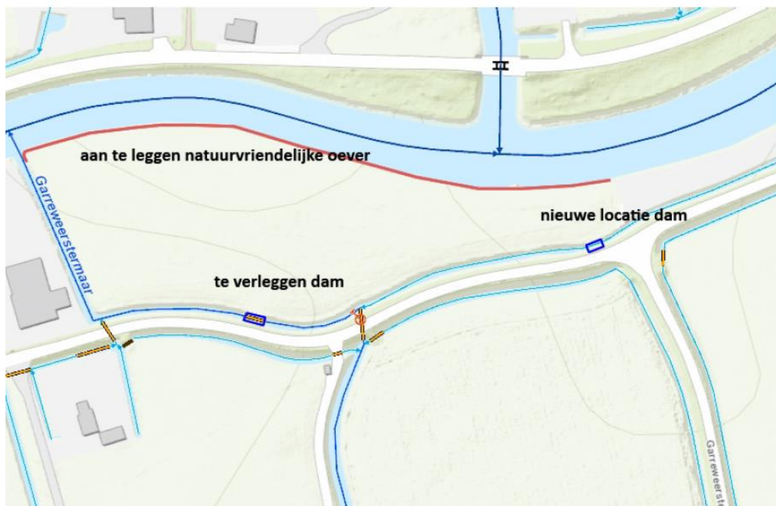
Figuur 1 Locatie 300m natuurvriendelijke oever Damsterdiep, de Winter(rode lijn)

De beide locaties liggen hemelsbreed op ca 1km afstand van elkaar en staan in open verbinding.