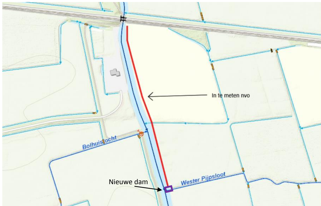
Figuur 2. Locatie aan te leggen NVO Oosterwijtwerdermaar, Brok.