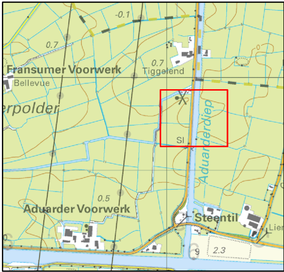
Overzicht schaal 1:20.000