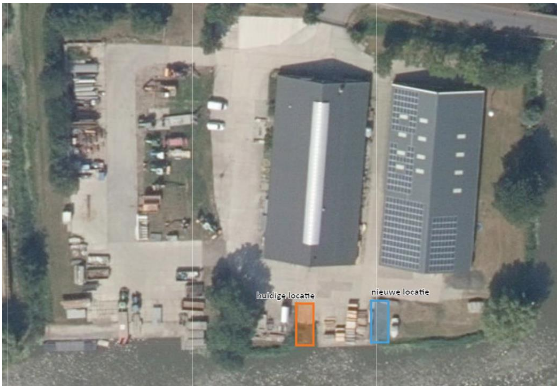
Afbeelding 2: huidige en nieuwe locatie boothelling